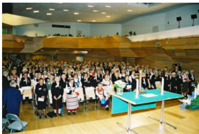
Rintamaisia jumalanpalveluksessa liiton 25-vuotisjuhlassa ja kesäpäivillä Dipolissa 2005